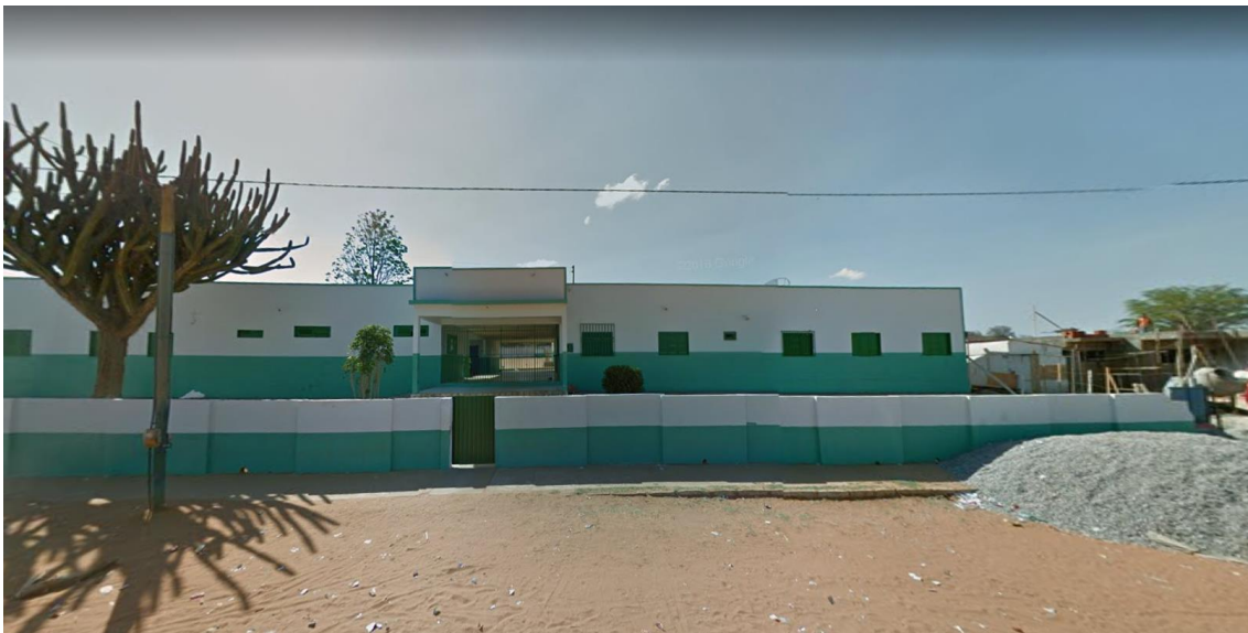
Figura 01 – Fachada Escola Municipal Joaquim Manoel da Silva